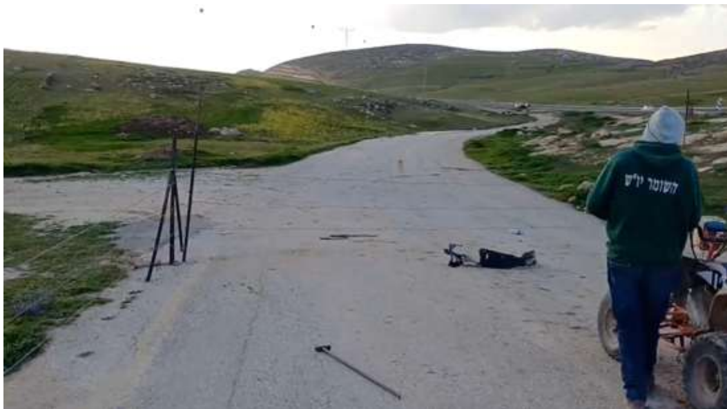
📷 Fotogramma tratto da un video che mostra alcuni coloni israeliani mentre erigono una recinzione intorno a Zanuta. Indossano felpe con il logo di Hashomer Yesh, un'organizzazione di coloni sostenuta dallo Stato; il video è datato 15 febbraio 2024.

Peace Now, un'organizzazione israeliana, ha scoperto prove secondo cui nel 2023 il governo ha destinato 28 milioni di shekel (circa otto milioni di dollari) a 68 avamposti coloniali dedicati alla pastorizia e a 33 avamposti, somma che è stata utilizzata per l'acquisto di droni, veicoli, telecamere, pannelli solari e cancelli elettrici. Nel luglio 2024, il ministro degli Insediamenti e delle Missioni nazionali ha confermato che il suo ufficio aveva stanziato 75 milioni di shekel (circa 23 milioni di dollari) per potenziare le infrastrutture di sicurezza negli avamposti. Tra aprile e luglio 2025, il governo ha trasferito almeno 48 fuoristrada agli avamposti non autorizzati, insieme a visori notturni, droni, apparecchiature di comunicazione e generatori.