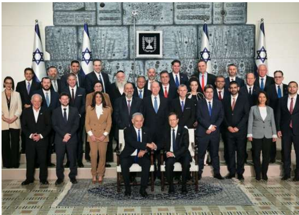
Il primo ministro israeliano Benjamin Netanyahu, il presidente israeliano Isaac Herzog e i membri del nuovo governo israeliano posano per una foto presso la residenza presidenziale il 29 dicembre 2022 a Gerusalemme.

Sin dall'occupazione israeliana della Cisgiordania, compresa Gerusalemme Est (che è stata annessa illegalmente), e della Striscia di Gaza avvenuta nel 1967, i governi israeliani che si sono succeduti hanno proposto piani di annessione volti a estendere l'autorità governativa israeliana sulla maggior parte del territorio palestinese, mantenendo al contempo una presenza palestinese minima.