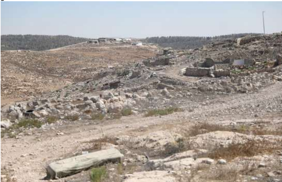
↑ Rovine di Zanuta in seguito alla distruzione del villaggio da parte dei coloni. Sullo sfondo, sulla collina che domina, è raffigurata la fattoria Meitarim. 1° settembre 2025.

A solo un 1 chilometro da Zanuta, i coloni israeliani hanno costruito un avamposto illegale conosciuto come Meitarim Farm nel 2021, dando presto inizio a una campagna prolungata di violenti attacchi e minacce contro le persone residenti a Zanuta. I coloni hanno dato fuoco alle tende e alle scuole del villaggio, fatto irruzione nelle case, hanno picchiato con fucili e lanciato pietre contro le persone residenti, hanno rotto i pannelli solari e le finestre, svuotato i serbatoi dell'acqua e pompato liquami sul terreno agricolo.