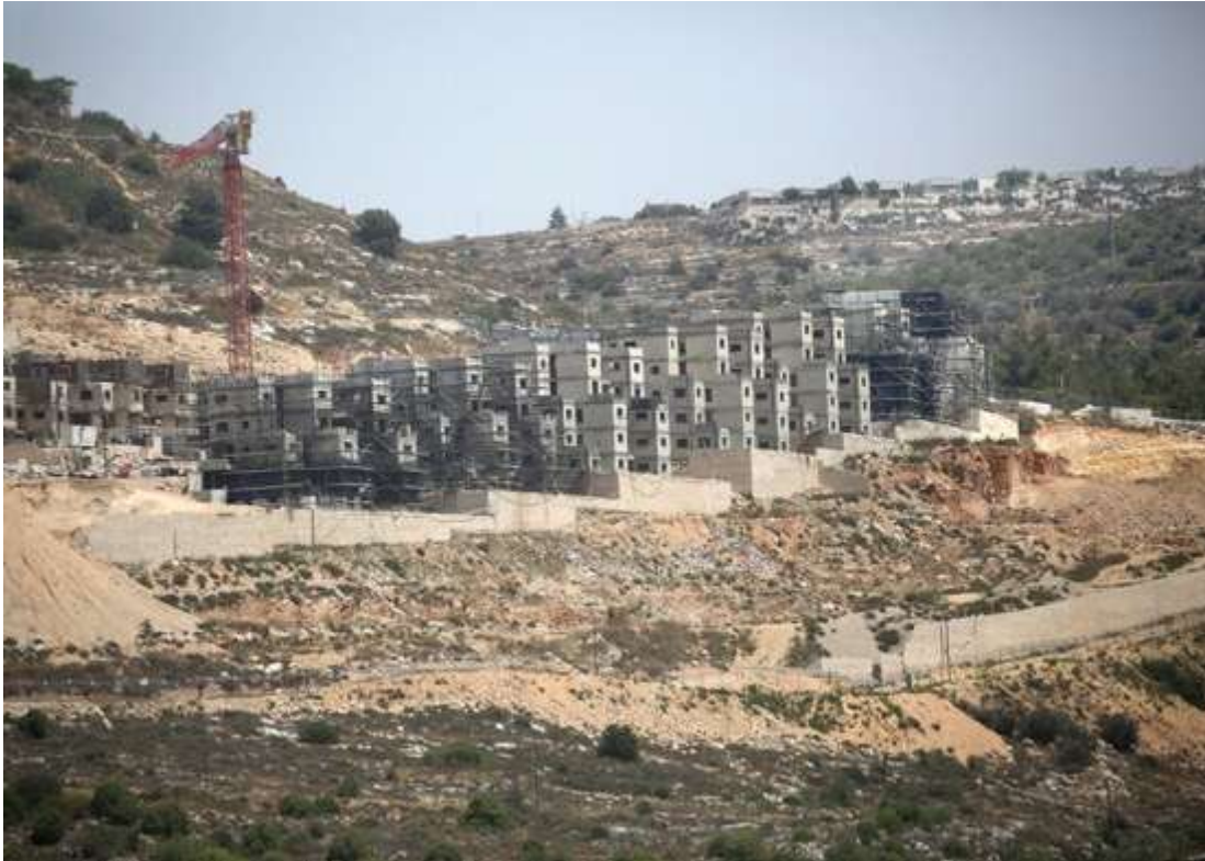
© Panoramica dei nuovi edifici nell'insediamento ebraico di Aliya, a sud di Nablus, in Cisgiordania. Nel maggio 2025, il governo israeliano ha approvato un'ampia espansione degli insediamenti ebraici e ha ripreso la registrazione dei terreni nell'Area C della Cisgiordania occupata, accelerando così gli sforzi di annessione. 19 maggio 2025 © Nasser Ishtayeh/SOPA Images/LightRocket via Getty Images

Tra il 2023 e il 2025, il governo ha promosso progetti per la costruzione di 50.785 alloggi negli insediamenti, secondo quanto riferito da Peace Now. Nel solo 2025, il Consiglio superiore di pianificazione ha approvato 27.941 alloggi, il dato annuale più alto mai registrato.